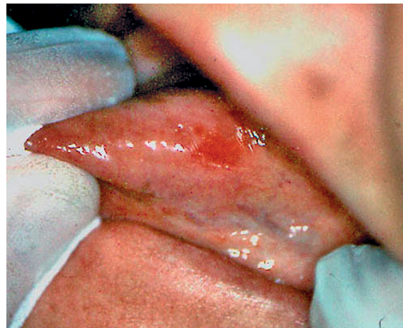
Figure 2 : Lésion érythémateuse du bord latéral gauche de la langue. Erythematous lesion of the left side of the tongue.