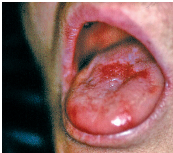
Figure 1 : Dépapillation partielle de la face dorsale de la langue. Partial exulceration of the dorsal face of the tongue.

Le bilan étiologique de cette anémie macrocytaire réalisé secondairement a objectivé l'origine vitaminique de cette macrocytose avec un taux sérique de vitamine B 12 effondré à moins de 74 \text{ pmol.l}^{-1} (N : 197\text{-}575 \text{ pmol.l}^{-1} ). Le taux sérique en folates ( 20,8 \text{ nmol.l}^{-1} ) était normal (N : 10,8\text{-}37,2 \text{ nmol.l}^{-1} ). Les lésions linguales observées lors de ce bilan n'avaient absolument pas migré et elles étaient en tout point identiques à celles observées lors de la première consultation.