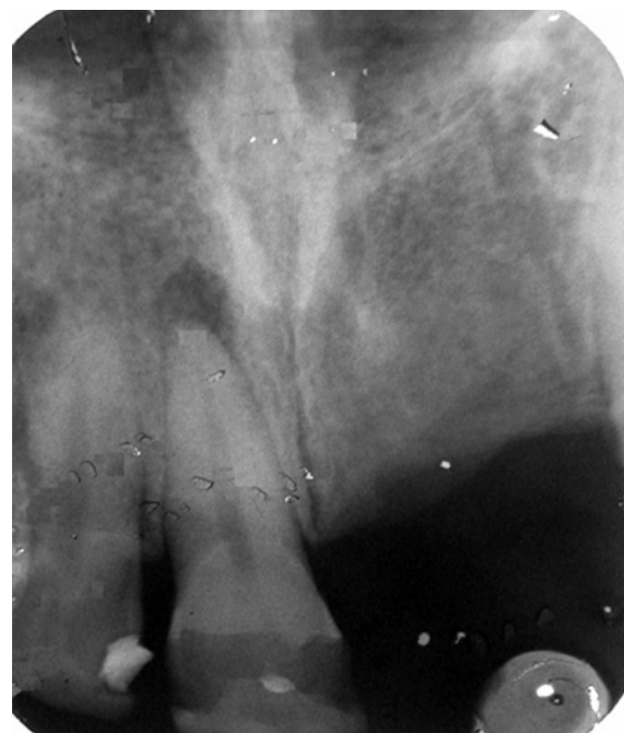
Figure 1 : Radiographie préopératoire ; lésion apicale. Diagnostic X-ray ; periapical lesion.

une importante cavité de carie qui communique avec la chambre pulpaire. L'examen radiographique retroalvéolaire montre une image radioclaire périapicale sur la 21 (Fig. 1). Ce tableau est caractéristique d'un abcès récurrent (abcès phœnix) sous-périosté d'origine endodontique [10].